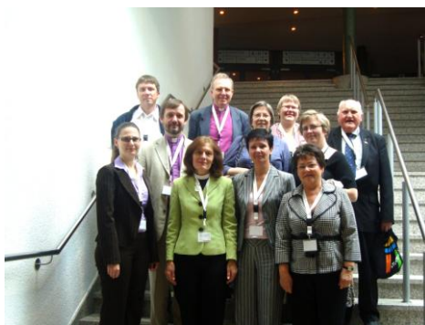
Baltijas valstu delegāti un viesi