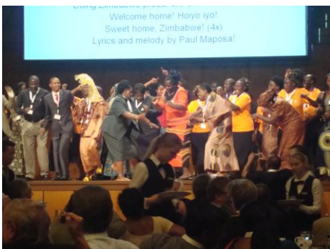
Tā priecājas un Dievu slavē Zimbabves luterāņi

11.asamblejā tūkstotis delegātu miljonu lielās saimes. Tika no visiem pasaules pārsteidzoši redzēt kristiešu kopību, sadraudzība un dārgas reformācijas jaunu pieredzi par attīstījusies liturģijā,