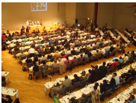
Asamblejas delegāti plenārsēdes laikā