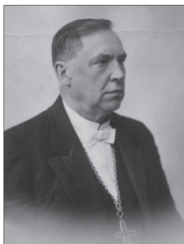
Bīskaps Kārlis Irbe